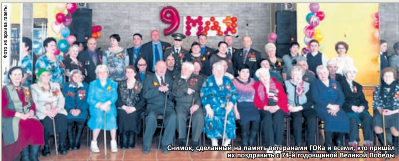
Снимок, сделанный на память ветеранами ГОКа и всеми, кто пришёл их поздравить с 74-й годовщиной Великой Победы

ПОСВЯЩЁННЫЙ 9 МАЯ ПАРАД ПЕРЕНЕСЁН НА БОЛЕЕ ПОЗДНЮЮ ДАТУ, И МЫ РЕШИЛИ ВСПОМНИТЬ, КАК ОБЫЧНО ПРОХОДИТ В НАШЕМ ГОРОДЕ ПРАЗДНОВАНИЕ ДНЯ ПОБЕДЫ