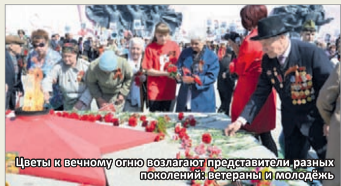
Цветы к вечному огню возлагают представители разных поколений: ветераны и молодёжь

Колонна работников Коршуновского ГОКа, как всегда, оказывается многочисленной. Открывают её знаменосцы и руководители предприятия. Представлено на параде каждое структурное подразделение комбината. Люди становятся в строй целыми семьями, многие с детьми, держащими в руках воздушные шары, живые гвоздики и неболь-