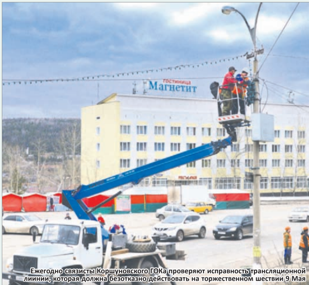
Ежегодно связисты Коршунковского ГОКа проверяют исправность трансляционной линии, которая должна безотказно действовать на торжественном шествии 9 Мая